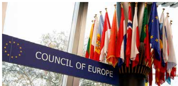
Der Europarat fordert auf, Funktechniken zu vermeiden.

Über 1500 unabhängige internationale Studien belegen die Schädlichkeit von Mobilfunk. Gremien ziehen daraus Konsequenzen: Die Europäische Umweltagentur stuft Mobilfunk 2013 als Risikotechnologie ein, die WHO 2011 als potentiell krebserregend. Der Europarat verabschiedet 2011 eine Resolution und fordert die europäischen Regierungen auf, „alle zumutbaren Maßnahmen [zu] ergreifen, um die Exposition elektromagnetischer Felder zu reduzieren.“